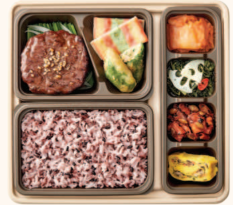
궁중떡갈비 반상 8,200