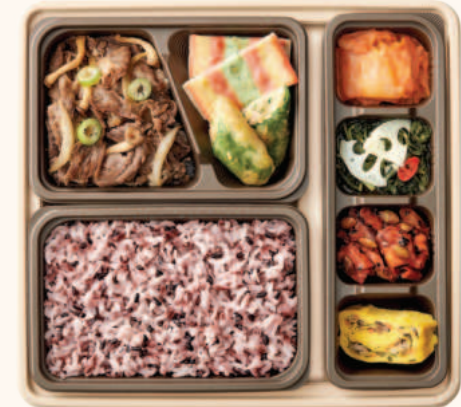
버섯소불고기 반상 9,700