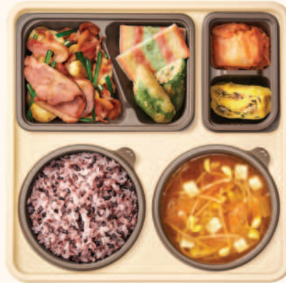
부추마늘오리구이 국반상 10,700