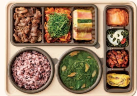
바삭불고기 깻잎제육 한상 12,400