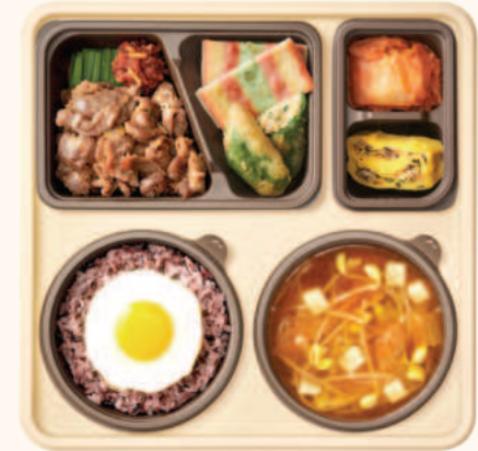
바싹불고기 국반상 8,900