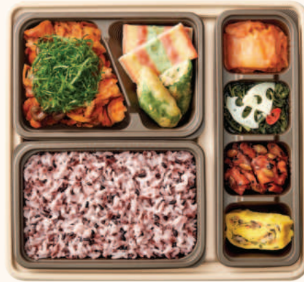
갯잎제육 반상 9,000