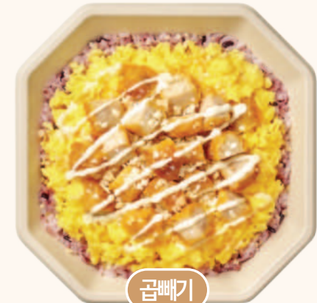
스크램블드에그 치킨마요 7,300