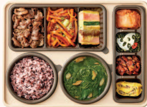
바삭불고기 오징어두루치기 한상 14,400