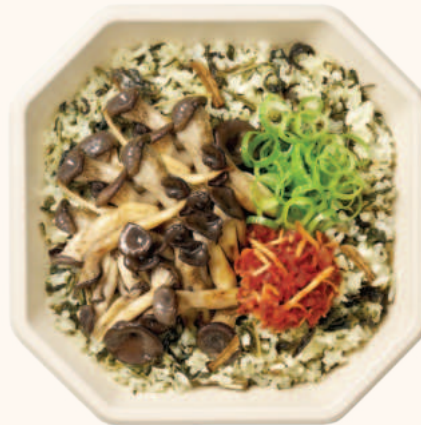
울릉도 나물 버섯영양밥 7,900