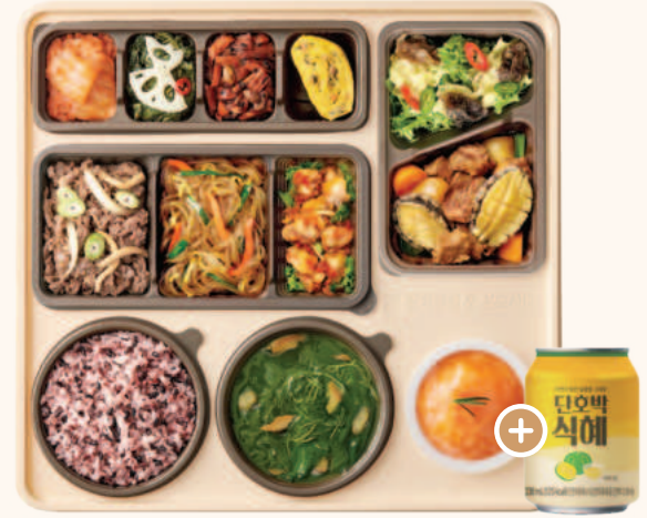
궁중 전복소갈비찜 한정식 29,900