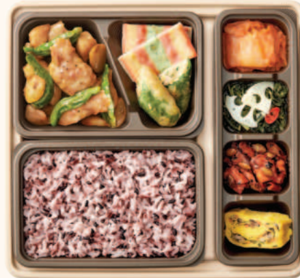
짜리닭구이 반상 10,000