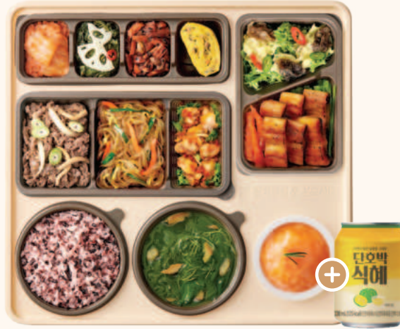
보양 고추장 더덕 장어구이 한정식 34,900